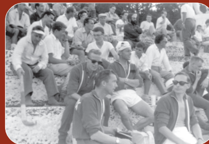
De danske hockeyspillere i deres røde træningsdragter slapper af under De Olympiske Lege i Rom 1960.