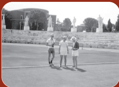
I hockeysammenhæng er Danmark en lilleputnation, men til De Olympiske Lege i Rom 1960 havde landsholdet kvalificeret sig. De danske hockeyspillere ser nærmere på Roms Stadio dei Marmi (Marmor Stadion), hvor en del af den olympiske hockeyturnering blev afviklet under OL 1960.